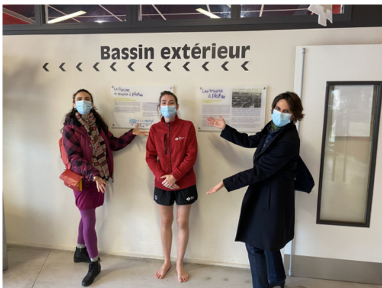
Les deux thérapeutes de l'association Ikigai qui assurent la formation et au centre Chlotilde, une des deux maîtres-nageuses formées actuellement.